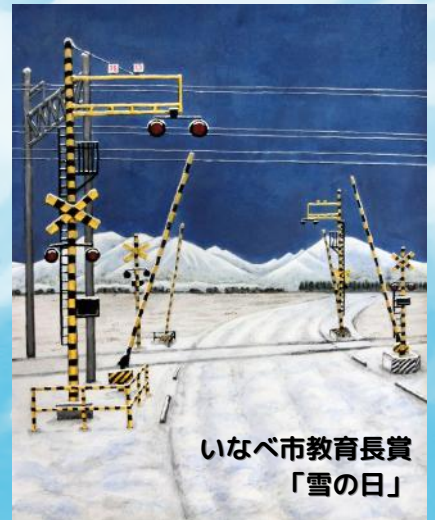
いなべ市教育長賞 「雪の日」