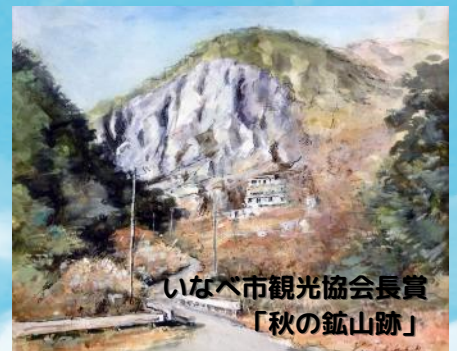
いなべ市観光協会長賞 「秋の鉱山跡」